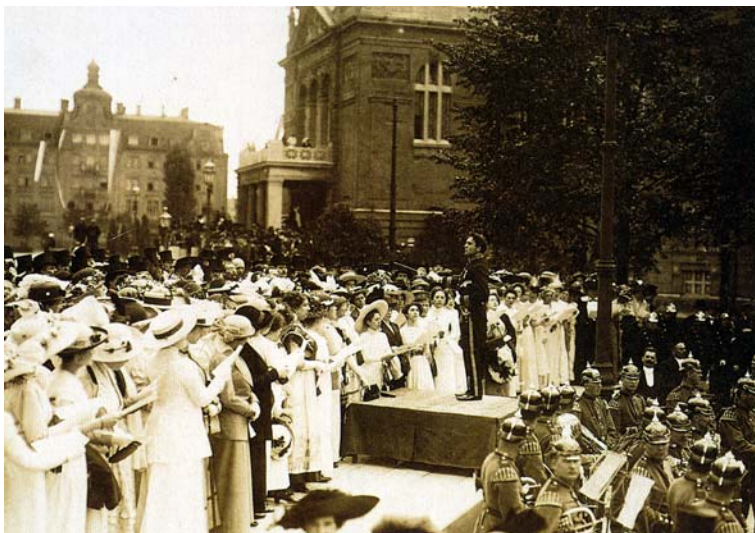
Einweihung des „Richard-Wagner-Denkmal“ am 21. Mai 1913

Ihnen, es ist toll, wie das hier getrieben wird, für und gegen Wagner. - Die Fama wächst zu einem hundertköpfigen Ungeheuer, der Wagner-Cultus wird zu einem Ekel; der junge König an der Spitze tauft alles, was ihn umgibt, in Tristan und Isolde um“. Am 10. Juni erfolgte die „Uraufführung“, über die die „Frankfurter Rundschau“ schrieb: „Das schönste und erhabenste Werk, welches die Welt besitzt“. Dagegen meinte „Der Volksbote“, eine bayerische Provinzzeitung: „Musik ein Tölsinn, Text ein Unsinn, das Ganze ein Irrsinn“.