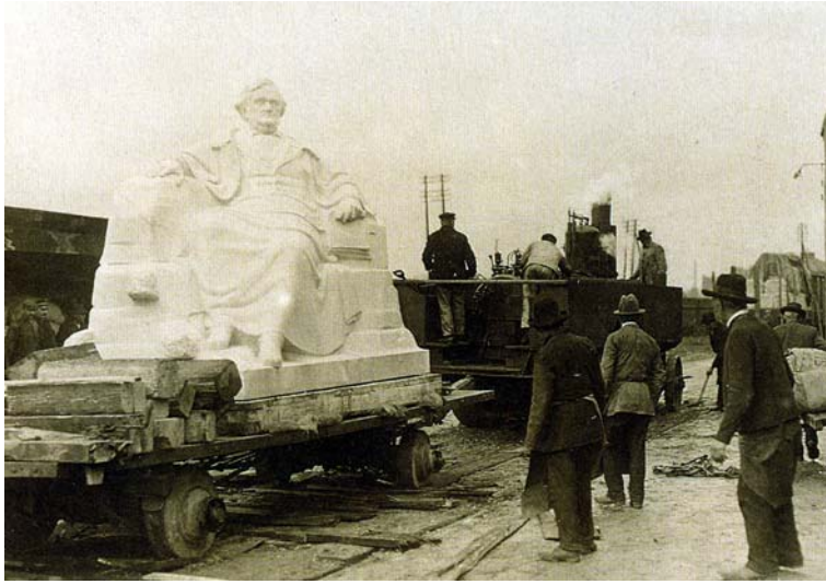
Transport des „Richard-Wagner-Denkmal“ zum Aufstellungsort