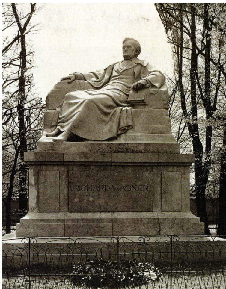
Die „Richard-Wagner-Statue“ an der Prinzregentenstraße, um 1913

erstehen, der jetzt energisch hilft. Ein gutes, wahrhaft hilfreiches Wunder muss mir jetzt begegnen; sonst ist's aus!“ Nur wenige Tage später, am 4. Mai, kam es zur ersten Begegnung zwischen dem damals hoch verschuldeten Komponisten und dem jungen bayrischen König Ludwig II.. Damit begann die fast neunzehn Jahre andauernde „Königsfreundschaft“. Nach dem Vertrag vom 18. Oktober 1864 war der „Ring der Nibelungen“ in das Eigentum des Bayernkönigs übergegangen. Am 4. Dezember 1864 erfolgte schließlich die erste Aufführung des „Fliegenden Holländers“. Mit diesem Werk und der gezeigten Inszenierung gelang es Richard Wagner, sich beim Münchner Publikum mit großem Erfolg einzuführen. Außerdem war diese „Holländer“-Aufführung das einzige große und damit herausragende Ereignis des Münchner „Opernspielplans“ in diesem Jahr.