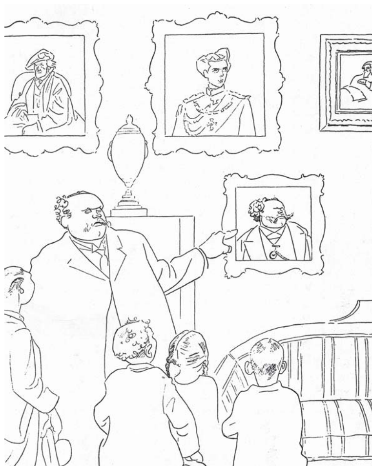
Bürgerdämmerung: „Dös is euer Großvater, schaugis'n an, den Deppn, der hot damals an Richard Wagner aa mit auspfiffn“