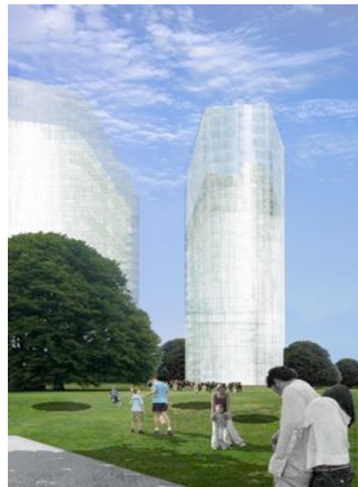
Der Siegerentwurf - Nieto Sobejano Arquitectos

Die drei erworbenen Grundstücke sind nicht nur zuletzt aufgrund der erfolgten Arrondierung ein attraktives Investment, sondern es besteht des Weiteren aufgrund der gegenwärtige Entwicklungen und Ansiedelungen im nachbarschaftlichen Umfeld ein erhebliches Wertsteigerungspotenzial.